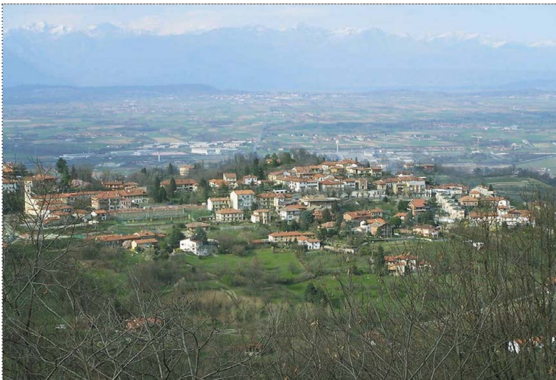
Figura 2. Nucleo storico di Castagneto Po (Torino).