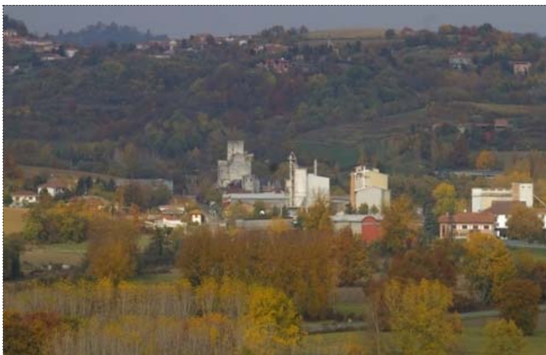
Figura 14. Colcavagno (Asti). (Fonte: Osservatorio del Paesaggio per l'Astigiano e il Monferrato. http://www.osservatoriodelpaesaggio.org ).