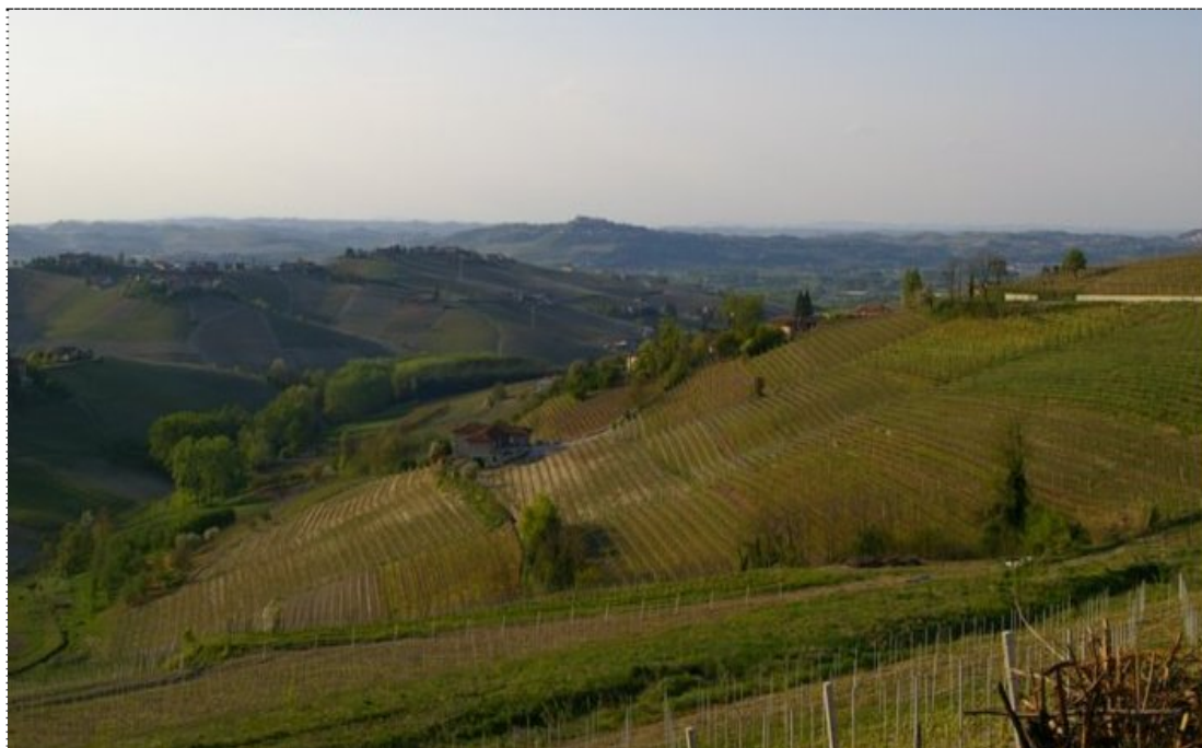
Figura 9. Veduta delle colline di San Marzanotto (Asti).