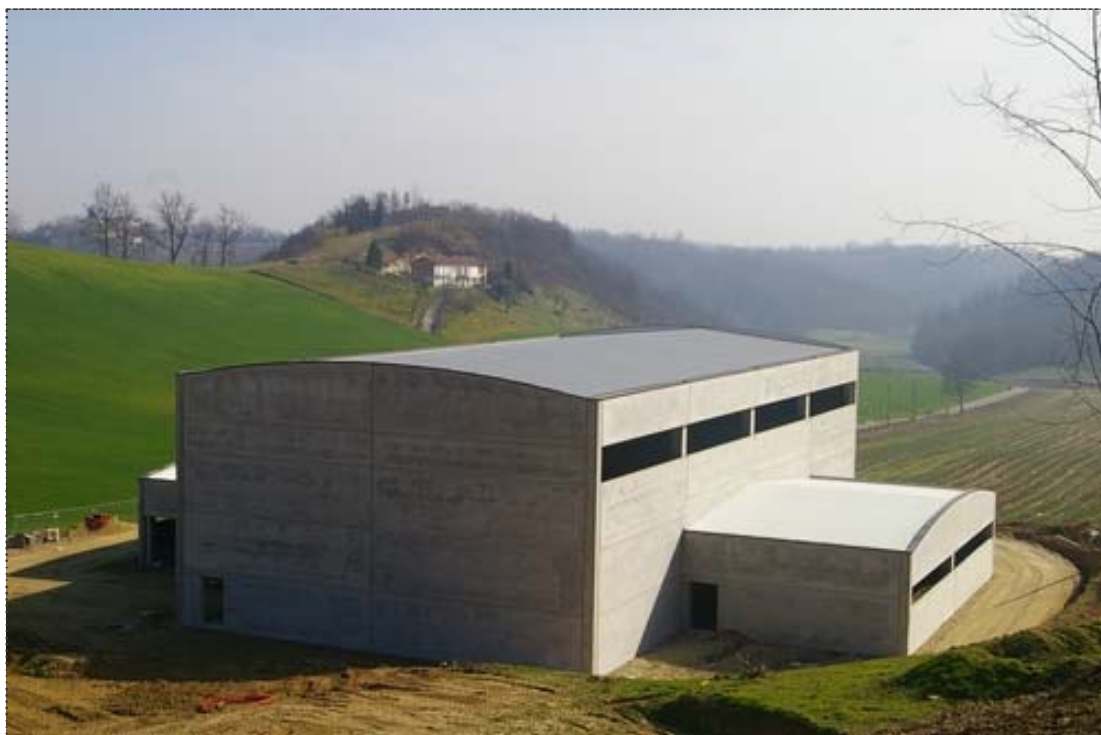
Figura 5. Capannone in costruzione a Cossombrato (Asti).