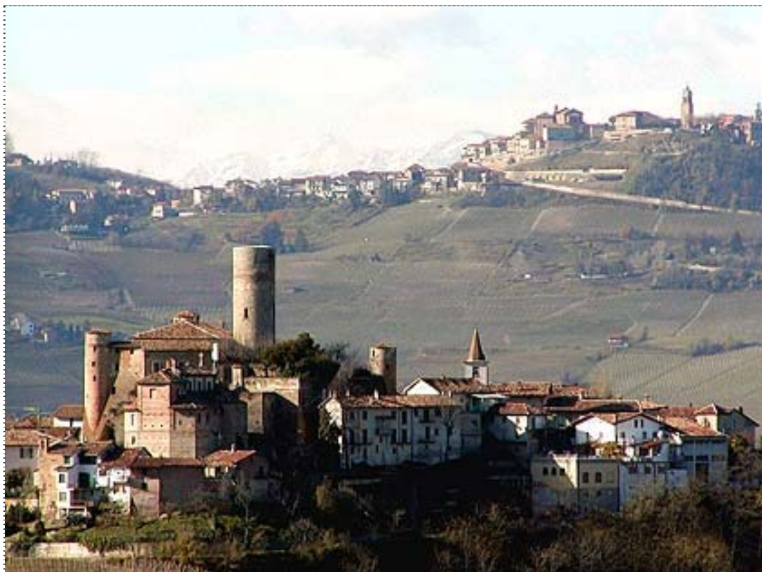
Figura 10. Castiglione Falletto (Cuneo).