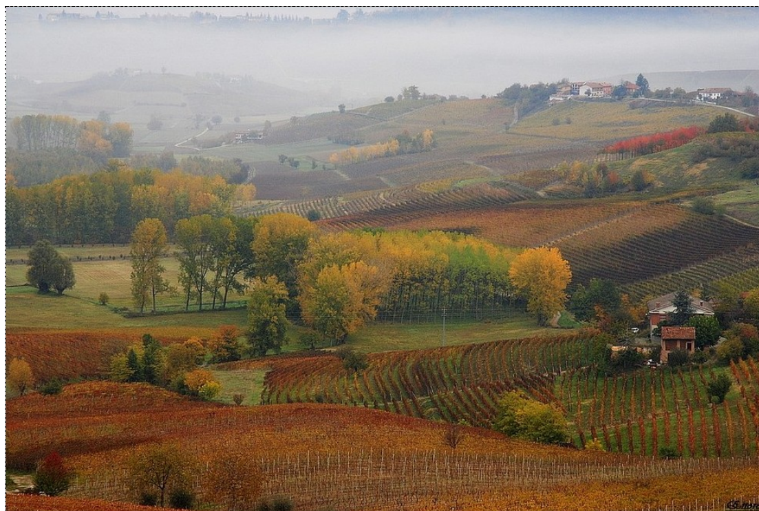
Figura 8. Veduta delle Langhe nei pressi di Barolo (Cuneo). (Foto di Ettore Caio. Fonte: http://www.fotocommunity.it ).