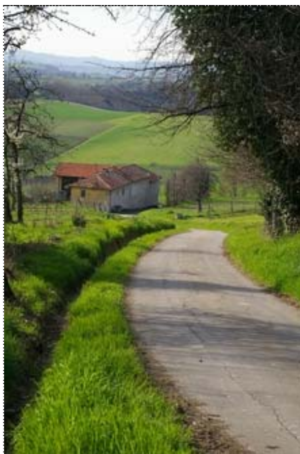
Figura 17. Villadeati (Asti)..

A questo codice di analisi e valutazione dovrebbe accompagnarsi un codice normativo, che fissi le regole di comportamento da adottate là dove si pongano problemi di modificazioni del territorio. Di questo codice del paesaggio collinare si sente un gran bisogno, in ragione dei guasti prodotti da una pervasiva e apparentemente inarrestabile disgregazione insediativa.