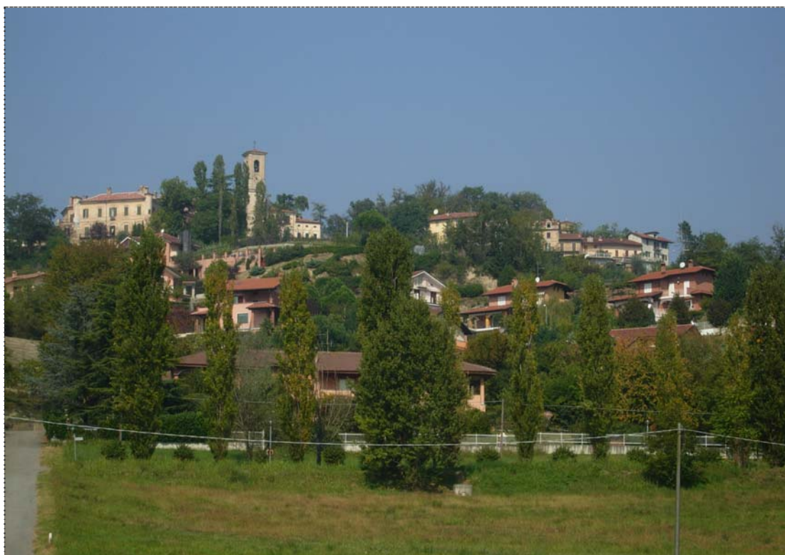
Figura 11. Nuovo insediamento residenziale lungo il versante collinare del Castello di San Sebastiano da Po (Torino).