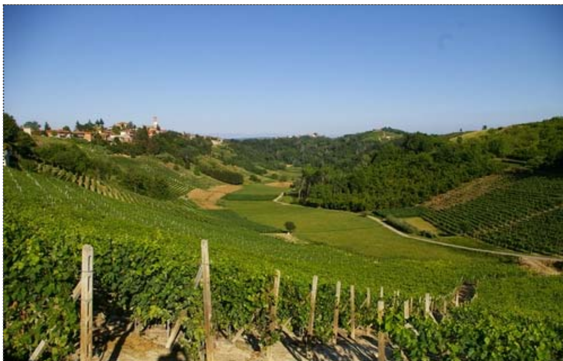
Figura 3. Veduta delle colline di Vinchio (Asti)..