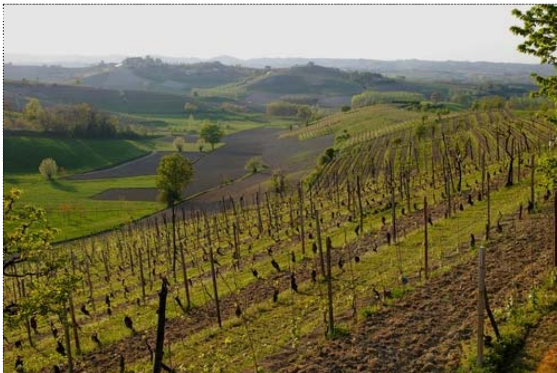
Figura 13. Veduta delle colline di Antignano (Asti).