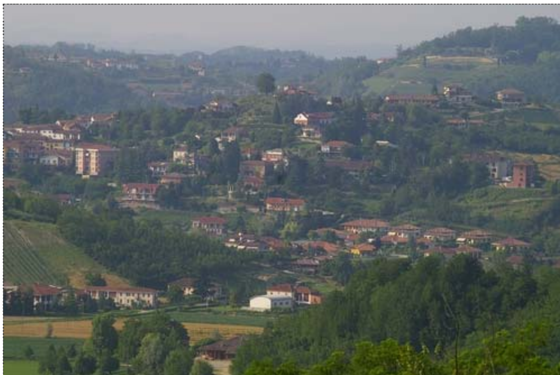
Figura 12. Insedimenti residenziali a Mombercelli (Asti). (Fonte: Osservatorio del Paesaggio per l'Astigiano e il Monferrato. http://www.osservatoriodelpaesaggio.org ).