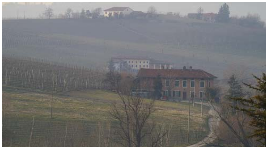
Figura 16. Strada collinare a Colosso (Asti). (Fonte: Osservatorio del Paesaggio per l'Astigiano e il Monferrato. http://www.osservatoriodelpaesaggio.org ).