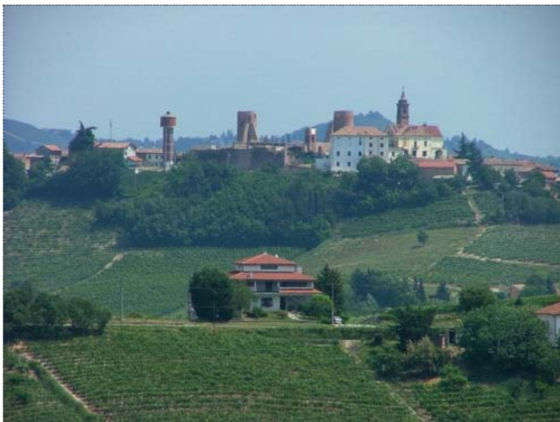
Figura 1. Veduta di Moasca (Asti).

Se dovessimo compilare una graduatoria dei paesaggi più sensibili, le coste marine guadagnerebbero sicuramente il primo posto, ma subito dopo dovremmo collocare i paesaggi collinari. È il modellamento morfologico che rende le colline al tempo stesso attrattive, per la promessa di dolci panorami, ed altamente vulnerabili all'impatto visivo che anche solo modeste costruzioni possono causare (figura 1).