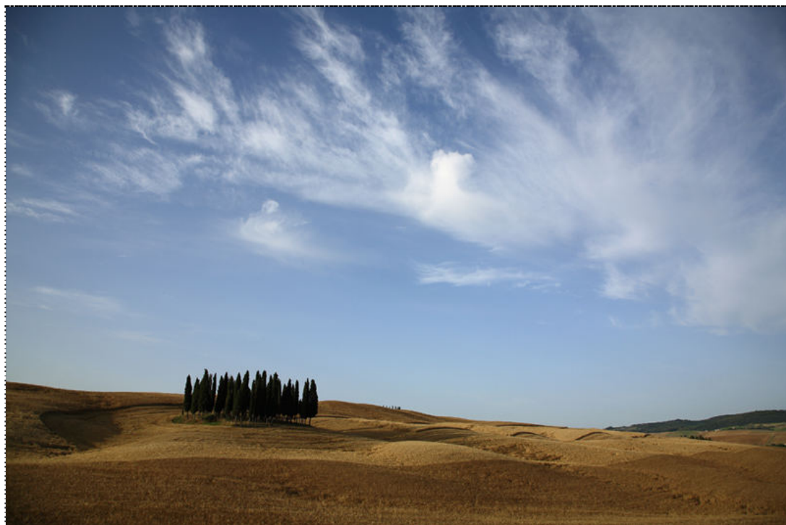
Figura 7. Veduta delle colline senesi.