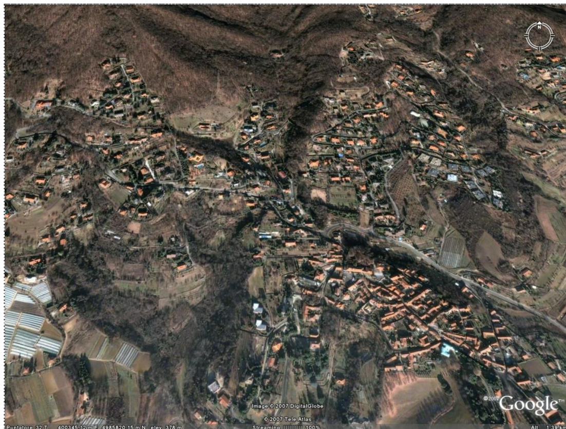
Figura 6. Dispersione residenziale sulla collina di Moncalieri presso Revigliasco (Torino).

Abitare in cima ad una collina, o sul versante esposto a mezzogiorno offre poi un clima tra i più favorevoli. La loro amenità ambientale assommata alla loro ipersensibilità paesaggistica ne fa uno dei paesaggi più gravemente minacciati di estinzione (figura. 6).