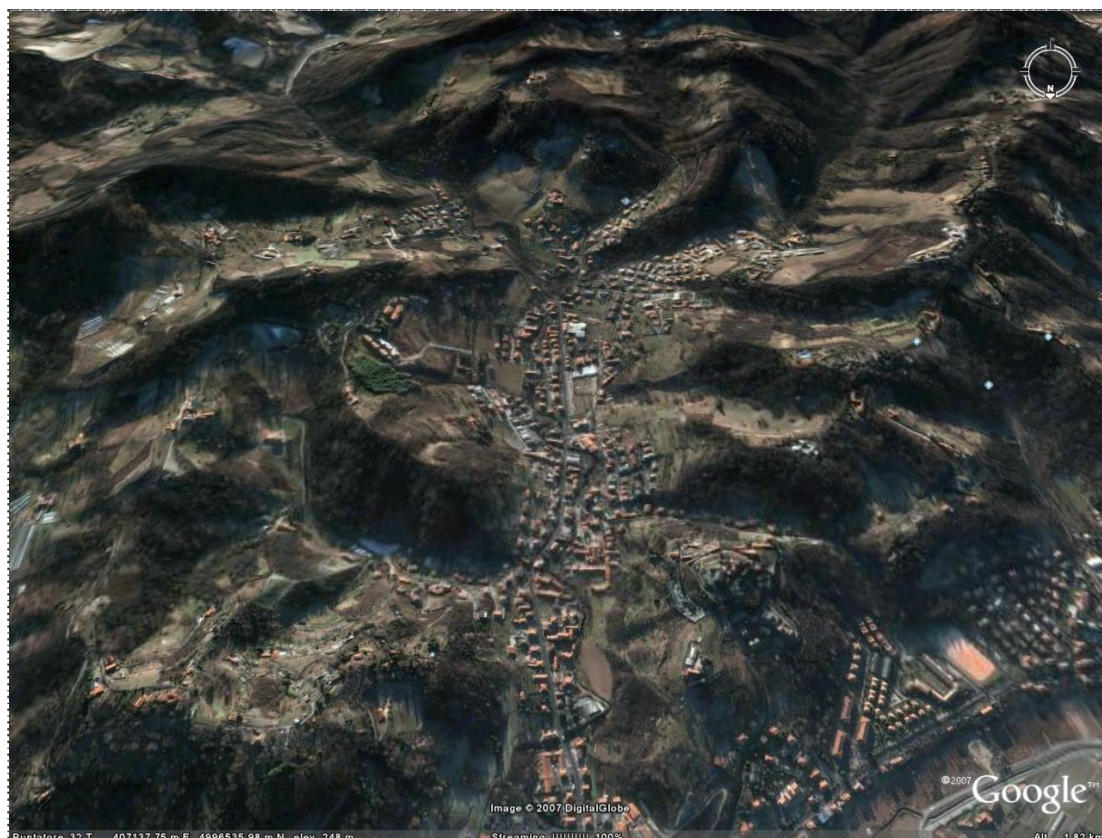
Figura 15. Insediamenti di fondovalle a Castiglione Torinese (Torino).